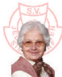
Schön Rosa ††